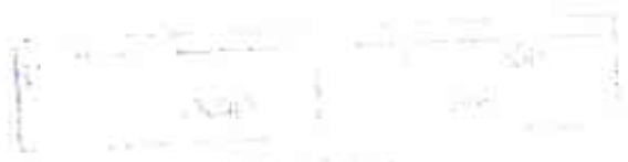
Diagram of the apparatus used for the experiment.