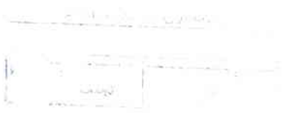
Diagram illustrating the flow of information in a process. The input is processed and the output is generated.